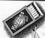
塩素酸カリウム (マッチ)